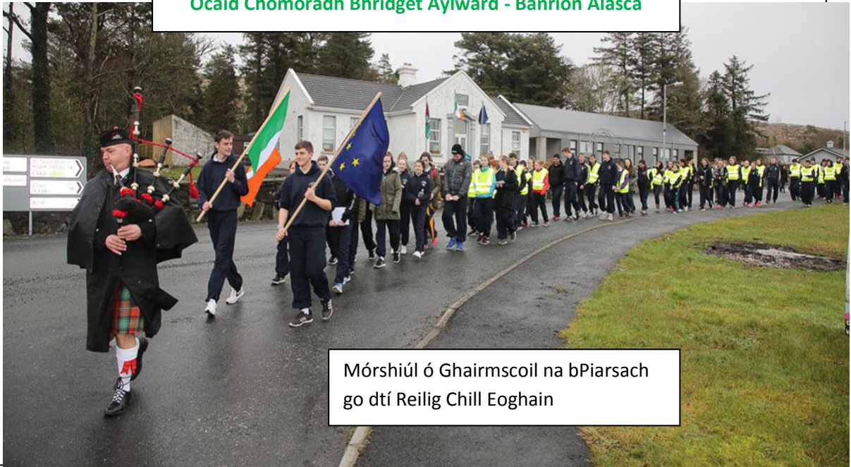
Mórshiúl ó Ghairmscoil na bPiarsach go dtí Reilig Chill Eoghain